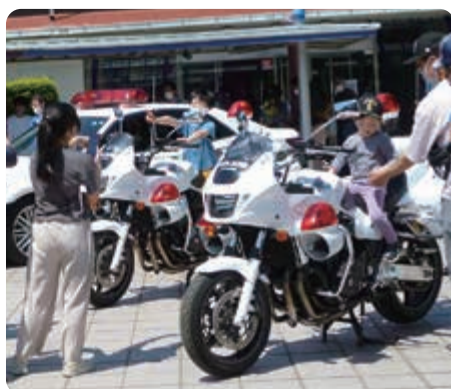
白バイ・パトカー