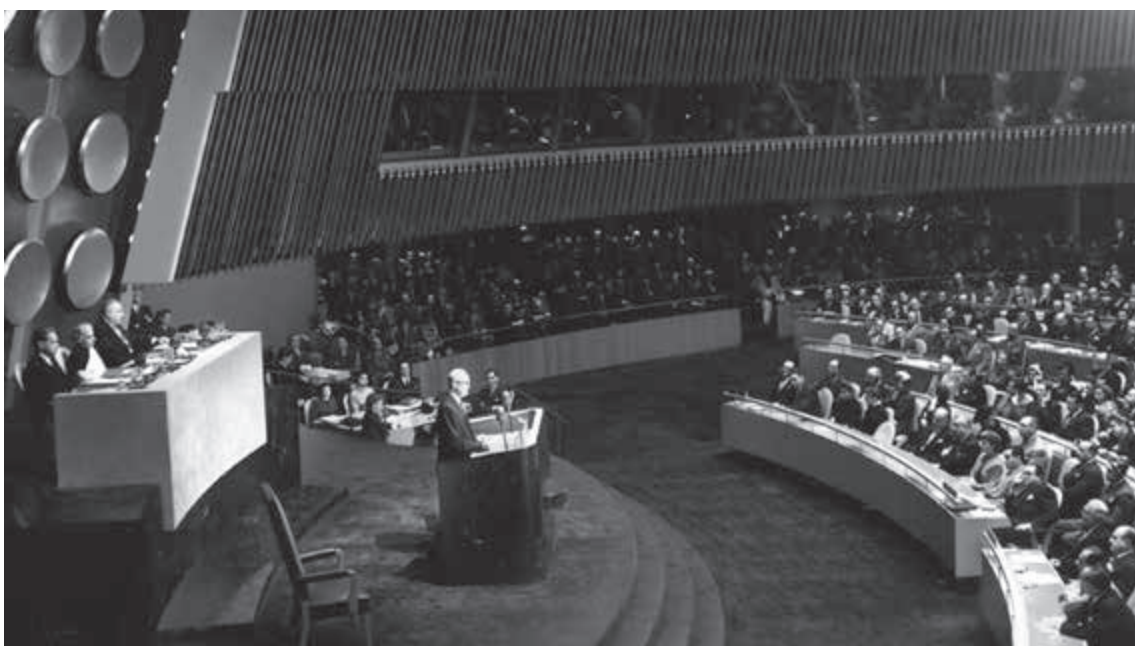
1953年の国連総会でのアイゼンハワー米大統領の演説(平和のための原子力)

https://www.mofa.go.jp/mofaj/gaiko/atom/iaea/iaea_g.html (IAEAの概要、外務省)