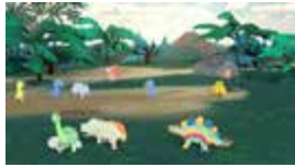
この『紙アプリ』は株式会社リコーの商標で、イベント向けソリューションです。

日時：8/1(火)～8/15(火) ①9:00～12:00 (入場は11:30まで) ②13:00～16:00 (入場は15:30まで)