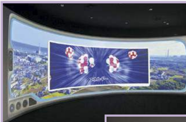
令和2年度 アトミックトラベル — 原子のカー —

発行 (公社)茨城原子力協議会 編集責任者 常務理事 浅野幸男 茨城県那珂郡東海村村松 225-2 TEL 029(282)3111 FAX 029(283)0526 http://www.ibagen.or.jp/