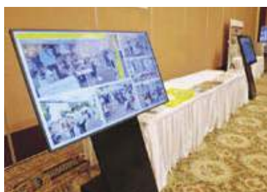
日本原子力発電株式会社