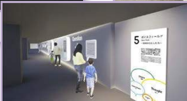
令和6年度 ボイスフィールド — 未来の私たち —