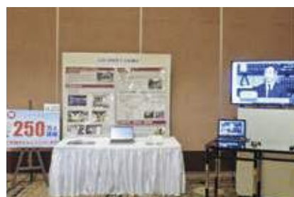
公益社団法人 茨城原子力協議会