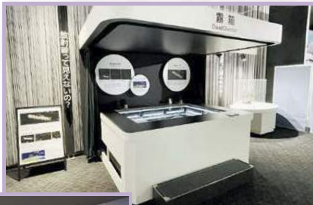
令和3年度 ラジエーションボックス — 放射線の正体 —